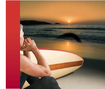
beginnendes Glaukom, mit leichtem Gesichtsfeldausfall

Das Auge ist das wertvollste Organ des Menschen. Über unsere Augen nehmen wir den größten Teil unserer Umwelt wahr. Ohne gesunde Augen hätten wir erhebliche Probleme, uns in unserer Umgebung sicher zu bewegen und zu orientieren.